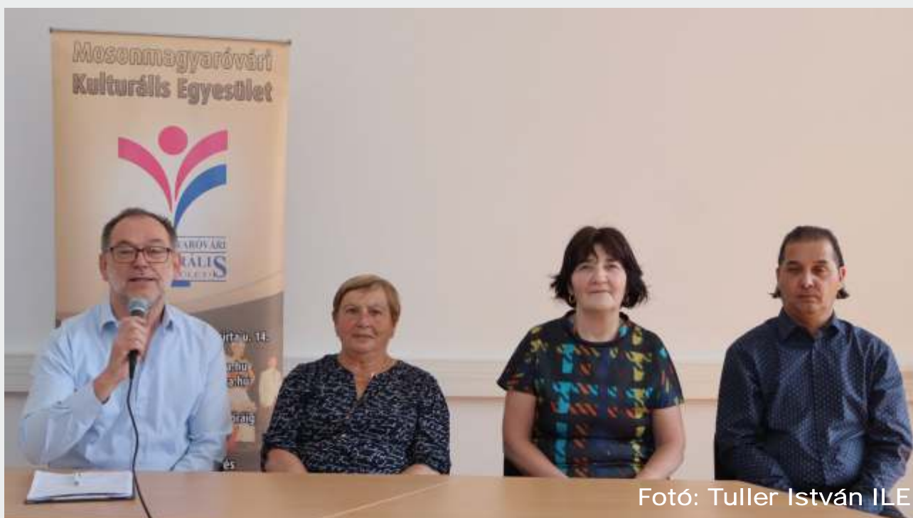
Fotó: Tuller István ILE